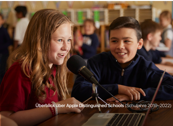
Überblick über Apple Distinguished Schools (Schuljahre 2019–2022)

Apple Distinguished Schools erklären sich bereit, an den von Apple unterstützten schulischen Veranstaltungen mitzuwirken, die Erfolgsgeschichte ihrer Schule zu veröffentlichen sowie bewährte Vorgehensweisen und Nachweise von Schülererfolgen mit anderen zu teilen.