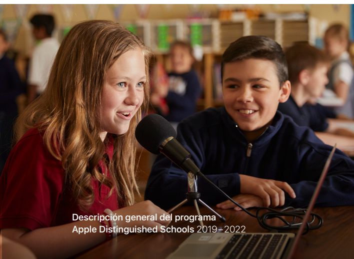
Descripción general del programa Apple Distinguished Schools 2019–2022

Los Apple Distinguished Schools están dispuestos a participar en jornadas de puertas abiertas patrocinadas por Apple, publicar la historia de éxito del centro, compartir las mejores prácticas y demostrar el buen rendimiento académico de los estudiantes.