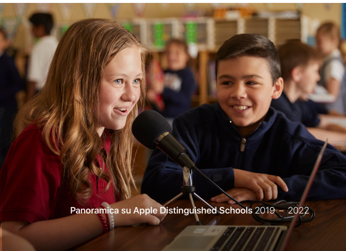
Panoramica su Apple Distinguished Schools 2019 – 2022

Le Apple Distinguished School sono disponibili a ospitare visite organizzate da Apple, pubblicare la storia dei successi dell'istituto e condividere best practice e testimonianze dei successi accademici degli studenti.