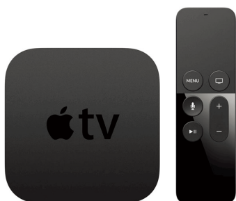
モデル MLNC2J/A, MGY52J/A 2015年9月9日発表